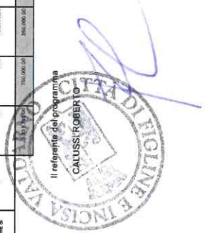
Tabella D.10 CUI: Classificazione Sistema CUP: codice sistema e sostanziale intervento

Tabella D.9 CUI: Classificazione Sistema CUP: codice sistema e sostanziale intervento